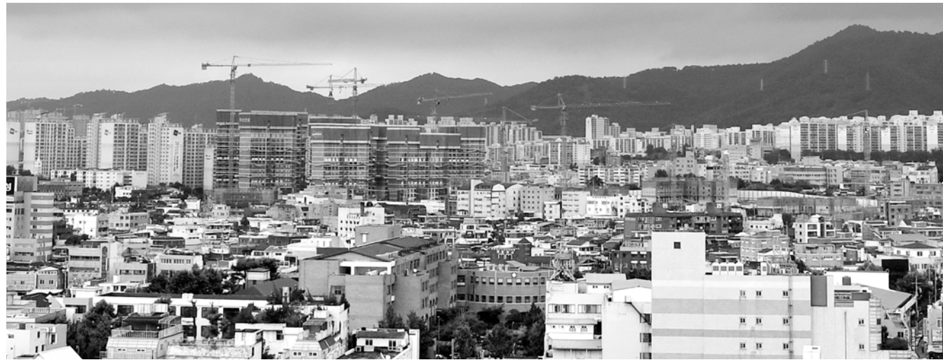
광주·전남 부동산 시장은 올해 규제정책으로 인한 위축으로 34% 정도 감소한 5000여 세대가 공급될 것으로 예상된다. 아파트가 곳곳에 들어서고 있는 광주 도심 전경.

올해 광주·전남지역 아파트 공급물량은 주택건설사들의 공급량 조절에 따라 지난해보다 34% 가량 감소하고 가격도 조정을 거칠 것으로 전망됐다. 대한주택건설협회 광주·전남도회에 따르면 지역 소재 주택건설 등록업체를 대상으로 올해 아파트 공급현황을 조사한 결과 신규 인성과 정부의 부동산규제정책에 따라 지역건설사들이 공급량을 조정할 것으로 나타났다. 지난해 지역 아파트 공급량은 광주 5989세대, 전남 1605세대로 총 7594세대였으나 올해는 부동산시장 위축으로 34% 정도 감소한 5000여 세대가 공급될 것으로 예상된다. 다른 지역에 공급되는 물량까지 포함하