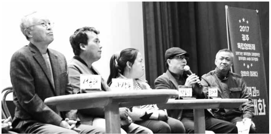
지난해 광주독립영화제에 초청된 광주시청자미디어센터 '세미다큐프로젝트' 참여자들.

또, 참여자 1인당 1작품 제작이 원칙이며, 다큐는 30분 분량이어야 한다. 기획과 촬영, 편집 등 제작 전반에 걸쳐 다른 참여자들과의 워크숍을 통한 회의 및 토론 과정을 통해 피드백을 주고받으면서 완성해가는 일종의 협동 프로젝트다. 제작에 필요한 촬영 장비와 편집 시설은 광주센터에서 지원한다. 시청자참여프로그램(라닝타임 최소 8분 이상) 1편 이상 참여자를 모집대상으로 하며 모집 인원은 총 7명이다. 참여를 원하는 이들은 오는 22일까지 지원서, 제작기획서, 자기소개 포트폴리오를 광주센터 홈페이지에서 다운 받아 제출하면 된다. 문의 062-650-0326. 광주센터는 또, 장애인, 이주여성, 노인