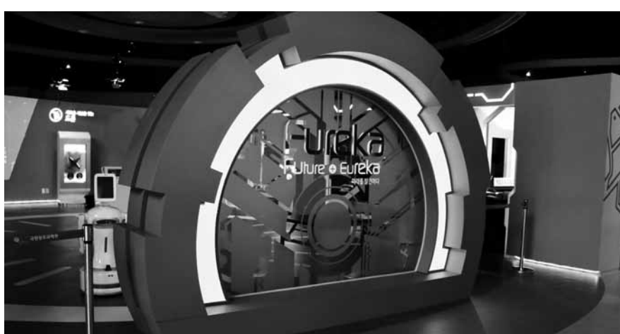
광주과학관 상설전시관의 '퓨레카(Fureka)' 입구.

적인 현대과학기술을 중심으로 구성되어 있다. 퓨레카는 2월 말까지 한 달간의 제한운영을 거친 후 3월 공개할 예정이다. 아이작 뉴턴부터 제임스 와트까지 각 분야의 과학기술의 발전을 이끌었던 인물들에 대해 알아볼 수 있는 '근대과학기술관'도 새롭게 문을 열었다. 빛과 소리를 넘어 현대 과학기술의 원리와 발전 단계를 알아볼 수 있는 과학교육의 현장이다. 또한, 영국의 로저 브라운 박사가 기증한 9점의 근대 실험기구들을 직접 볼 수 있다. 문의 062-960-6172. /전문기자 ej6621@