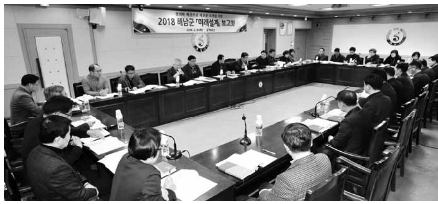
해남군이 최근 전체 부서 공무원이 참석한 가운데 미래 비전과 전략 설정을 위한 미래설계 보고회를 가졌다.

이번 보고회는 민선 7기 출범을 앞두고, 지역 발전을 위한 장기적인 비전을 마련하는 한편 군정의 각 분야별 중점 운영 방향과 주요 사업들을 설정해 전환기 누수없는 군정의 추진을 위해 마련됐다.