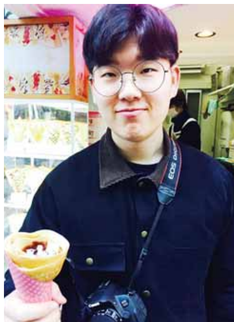
가르치고 인솔하는 게 적성에 맞다는 것을 느끼고 티라 '남자 유치원 선생님?'으로 대표되는 주변의 시선은 신경쓰이지 않았다고 한다.

지난해 전남대 교육학과를 졸업한 그는 2015년 군 전역 후 유아교육을 복수전공으로 선택하면서부터 유치원 교사의 꿈을 키워왔다. 학창시절 여류 성경학교, 주일 예배 등 교회에서 어린이들과 함께하는 시간이 많았는데, 이 과정에서 어린이들을 좋아하고 그들을