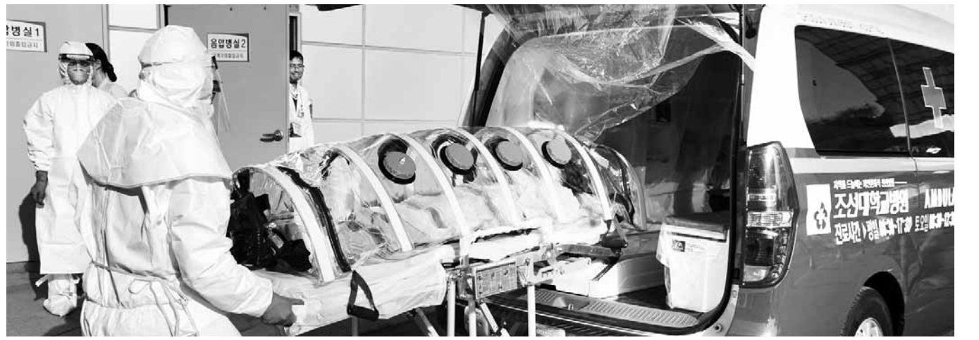
조선대병원 의료진이 감염질환 환자발생을 가정해 음압병상 가동 훈련을 하고 있다.