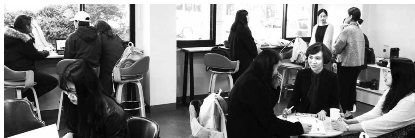
동강대학교가 최근 새롭게 문을 연 취·창업지원센터 'Job 카페'에서 학생들이 상담을 받고 있다.

또 산학협력 전문 교수진을 배치해 1:1 취·창업 상담과 이력서 및 자기소개서 작