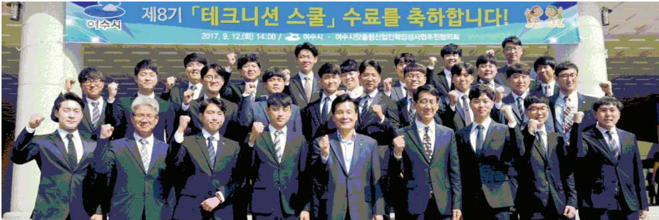
주철현 여수시장이 지난해 열린 제8기 테크니션 스쿨 수료식에 참석해 수료생을 격려하고 있다.

여수시가 지역인재를 육성하기 위해 차별화된 교육정책을 펴 결실을 맺고 있다. 여수시는 올해에도 초·중·고 교육경비 지원과 시민 평생학습 분야에 총 114억원의 예산을 편성했다고 12일 밝혔다. <교육공동체 개선 민·관 협의체 구성 행복교육지원센터 개원=여수시 행복교육지원센터는 주철현 시장의 민선6기 핵심 공약인 사업의고의 맥을 잇는 사업이다. 지난 2015년 말 학교설립 반대 의견을 가진 교육단체들과 논의의 위를 행복교육민관협의체를 만들었다. 민관협의체는 결성 후 지역 교육공동체 개선을 위해 중등교육환경 개선과 창의인성교육 지원 등 2가지 분야로 나뉘는 의의를 이어왔다. 그 결과 중등교육환경 개선 운영을 지난해 마무리했으며, 시는 운영결과에서 제시된 지역교육 선도모델(안)에 대한 지역민 의견수렴과 함께 각계각층이 참여하는 교육 거버넌스를 만들 계획이다. 이와 함께 민관협의체는 창의인성교육과 맞춤형 진로진학서비스를 시가 직접 지원하는 교육지원기구를 제안했고 시는 지난해 전남에서는 최초로 행복교육지원센터를 개원했다. 행복교육지원센터는 총 26억 원의 예산을 편성해 직접 교육지원 사업을 집행하며 학생과 학부모들의 만족도를 높이고 있다. 이외에도 시는 국내에서 두 번째인 가정 여수국제교육원을 유치했다. 국제교육원은 오는 14일 옛 여수시 돌산청사에서 개원할 예정이다. 교육원은 국제문화체험센터와 미디어센터, 원격화상교육센터 등이 들어선다. <교육국제화 특구 추진=교육경비 13년간 총 745억원 지원=여수시가 2013~2017년에 이어 교육국제화 특구로 재지정 돼 글로벌 인재양성 교육을 이