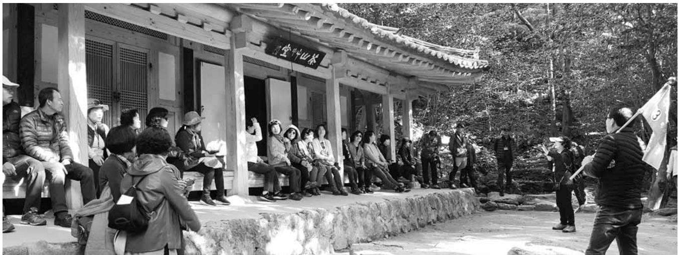
다산공직관 청렴교육에 참가한 공무원들이 다산초당을 찾아 정약용의 위민·애민정신에 대한 이야기를 듣고 있다.