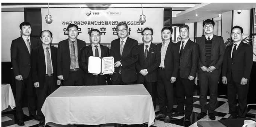
지난 15일 서울 강남의 한 레스토랑에서 장흥군과 SG다인힐 관계자들이 '장흥한우 숙성용 스테이크 개발 업무제휴' 협약을 체결한 후 기념촬영을 하고 있다.

장흥군과 손을 잡은 SG다인힐은 최근 새롭게 선보인 프리미엄 스테이크 하우스