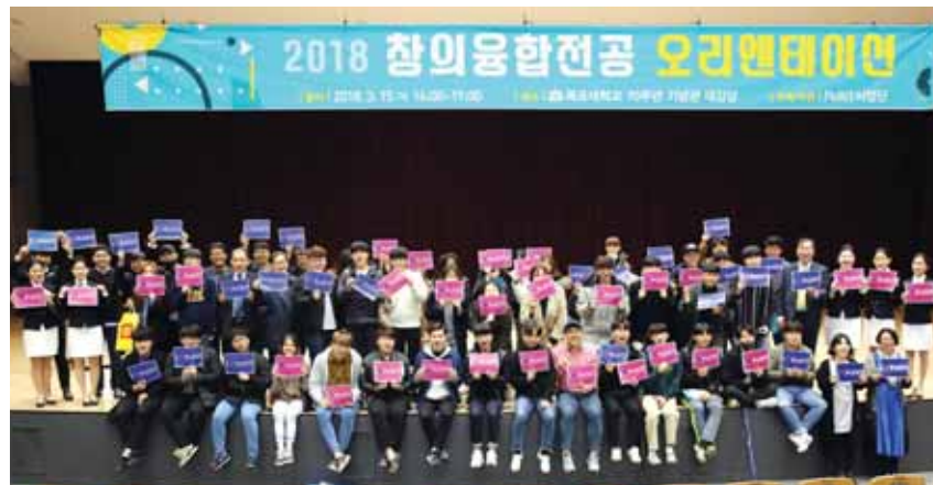
목포대학교 PoINT사업단은 최근 도림캠퍼스 70주년 기념관에서 창의융합전공 참여 교수 및 재학생 등 150여명이 참석한 가운데 '2018. 창의융합전공 오리엔테이션'을 개최했다.