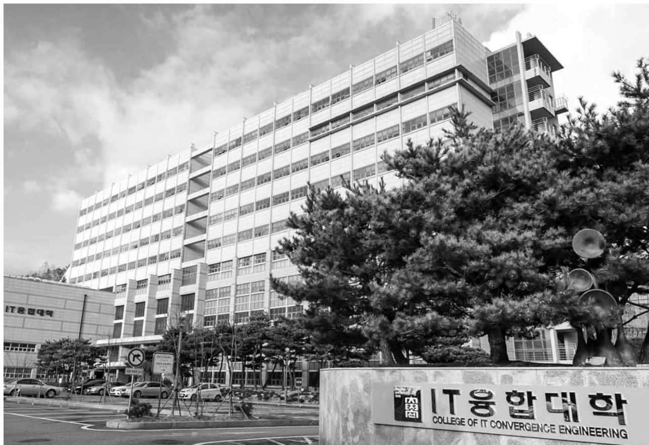
조선대학교 IT융합대학 전경. 조선대는 지난해 SW·HW 교육 인프라 구축을 위해 5500평 규모의 최첨단 IT대학 건물을 신축했다.

올해 입학한 SW특기자 신입생들에게는 장학금을 4년간 100% 지원한다. 컴퓨터공학과(120명), 전자공학부(IOT 전공·60명), 정보통신공학부(임베디드 보안전공·30명) 등 SW전공 신입생 전원에게도 장학금(성적에 따른 차등 지급)을 100% 지원한다. SW전공 재학생들(정원상위 25%)에게도 학기당 200만원 안팎 장학금이 지급된다. 타 전공과정에서 SW전공 과정을 연계 및 복수전공하는 학생에게도 장학금을 지급한다. 올 신입생부터는 졸업이수 학점도