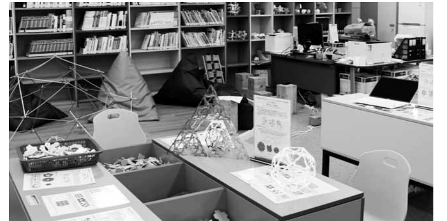
초·중·고교생들이 체험으로 수학을 배울 수 있는 광주 수학체험센터.

한편 조선대학교는 1998년 SW단과 대학인 정보과학대학을 호남 최초로 설립하고, 2000년에 전자정보공과대학으로 개편해 SW와 HW를 융합하는 교육체계를 확립했으며 교육 인프라 구축을 위해 5500평 규모의 최첨단 IT대학 건물을 신축했다. 또한, 광주시와 함께 4차 산업융합연구원을 설립, 광주시의 산업구조를 Industry 4.0 체제로 재편하는 전략을 추진할 계획이다. <윤영기자 penfoot@kwangju.co.kr>