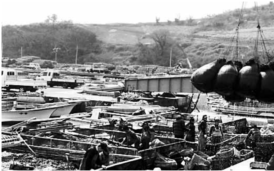
고흥지역 물김 생산 어민들이 고흥수협 풍화지점 발포항에서 위판에 앞서 하역작업을 하고 있다.

해 11월부터 물김을 생산, 군 수협 위판장을 통해 2018년산 물김을 위판 판매했고 있다.