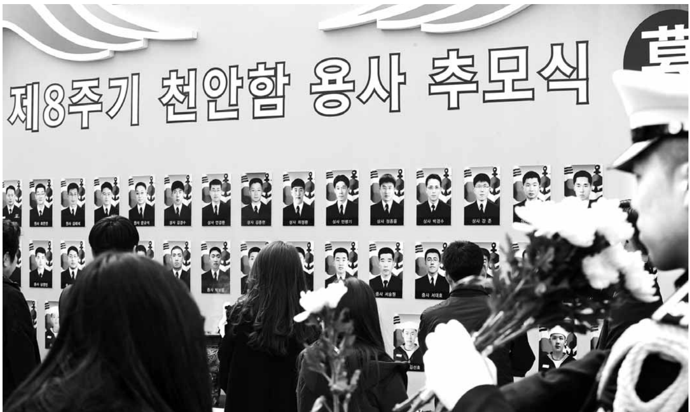
天安합 8주기 26일 오전 경기도 평택시 해군 제2함대사령부에서 열린 ‘제8주기天安합 용사 추모식’에서 참석자들이 헌화를 하고 있다.