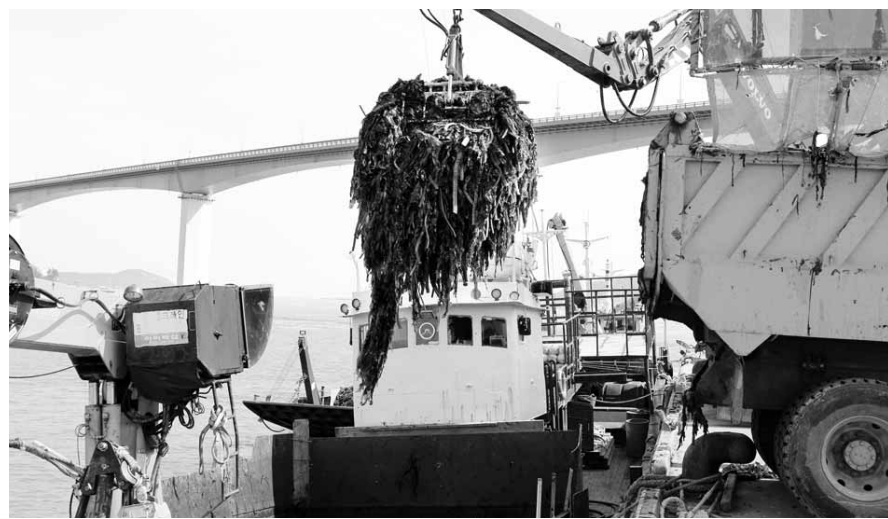
어민들이 완도 해역에서 생산돼 운반선에 실려온 미역을 가공공장으로 옮기기 위해 하역작업을 하고 있다.

지역 23개 가공업체가 보유한 2017년산 재고 물량이 여전히 중국과 인근 고흥군의 생산량 증가 등으로 기존 kg당 145원에 판매됐던 미역이 현재 60~80원 선을