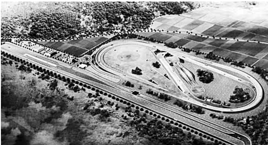
군산 상용차부품 주행시험장 조감도.

시설이다. 주행시험장은 차량 개발단계에서의 핵심부품과 완성차량의 각종 시험을 지원하는 시설로 상용차부품 실증시험이 가능한 다양한 시험로와 엔지니어링동이 들어서게 된다. 시험로에는 상용차 부품·시스템(모듈)과 차량의 내구 및 성능 등을 평가하기 위한 저마찰로, 상용고속주회로, 내구시험로(24중), ISO 소음시험로, 원선회로, 종합시험로, 등판로 등 주요 8개 시험로가 구축된다. 이번 주행시험장의 본 시험로 공사에는 설계단계에서부터 영국에 소재하고 있는 세계적인 시험인증기관인 '미이라(MIRA)'가 참여하고 있다. 이외에도 중대형 상용차의 안전 관련 시험 연구장비도 2021년까지 도입이 완료될 예정이다.