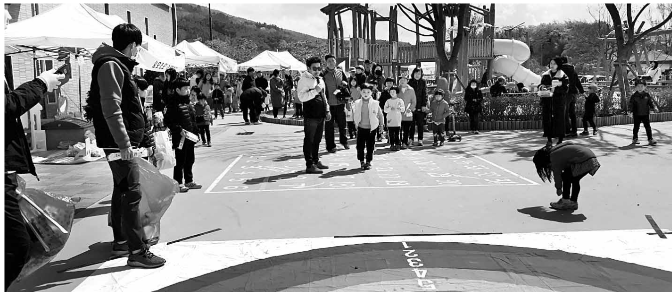
저출산 극복 'free day 두물마당' 개최. 지난 7일 고창군 육아종합지원센터에서 열린 '제4회 free day 두물마당' 행사 참가자들이 상상놀이터에서 게임을 하고 있다. 고창군은 가족친화적인 환경조성과 저출산 인식개선을 위해 매년 행사를 개최하고 있다.

로 추가 지정·고시하게 됐다. 전남지역 1~3종 시설물은 이번에 추가 지정된 213개소를 포함해 총 300곳이다. 이에 따라 상시 정밀점검, 정밀안전진단을 실시해 보다 철저하게 시설물을 관리하게 됐다. 임병을 전남도 도로관리사업소장은 "도지사가 관리하는 지방도와 위임국도에 대한 3종 시설물 지정을 계기로, 시장·군수가 관리하는 교량에 대해서도 3종 시설물 지정·고시를 조기 추진하도록 유도해 '안전 전남'을 실현하겠다"고 말했다. /박정욱기자 jwpark@kwangju.co.kr