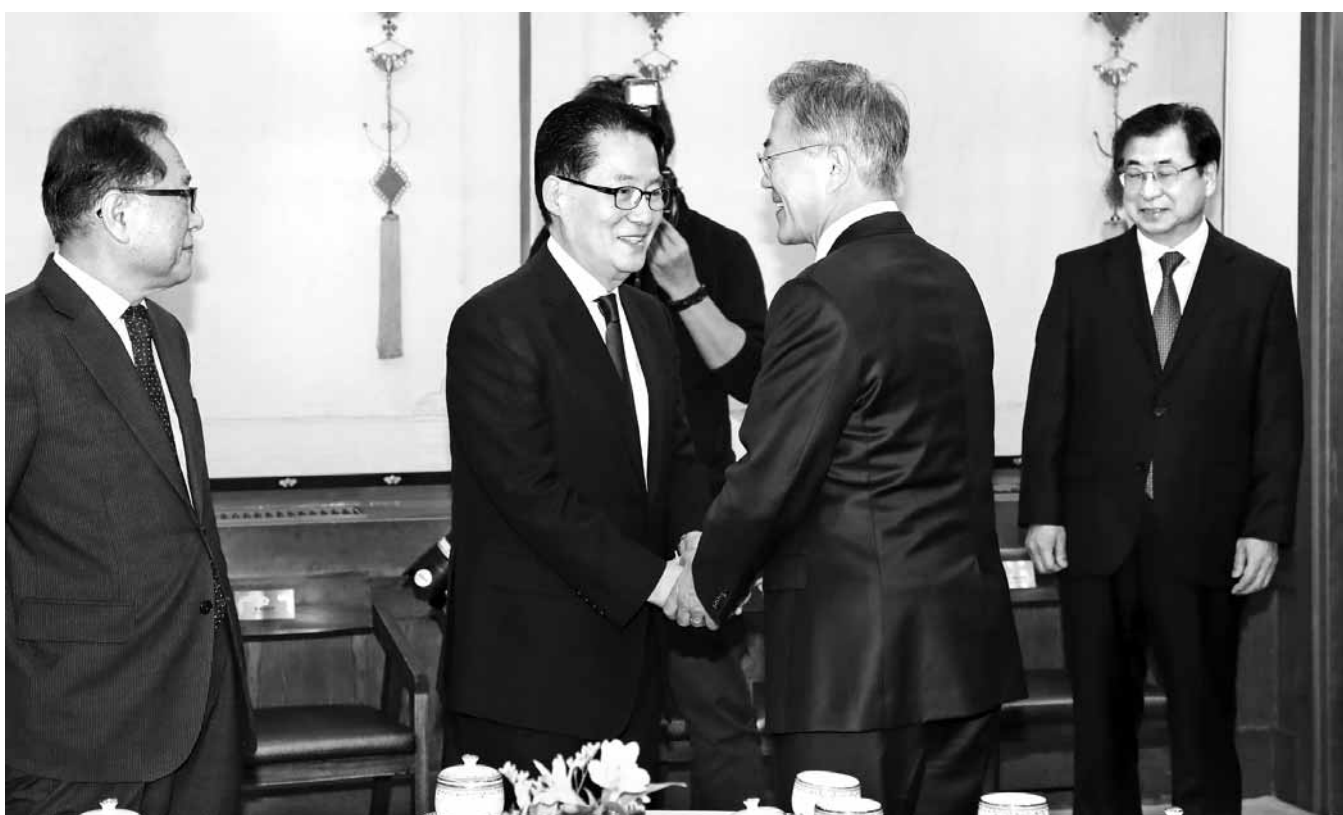
문재인 대통령이 12일 낮 청와대에서 남북정상회담 원로자문단과 오찬을 함께 하기 앞서 열린 사전 환담에서 민주평화당 박지원 의원 등 자문위원들과 인사하고 있다. 왼쪽은 정세현 한반도평화포럼 이사장, 오른쪽은 서훈 국정원장.

문 대통령은 “한반도의 완전한 비핵화와 항구적인 평화 구축, 그리고 남북관계의 지속가능한 발전의 길로 나아갈 수 있는 두 번 다시 오기 힘든 기회가 될 것”이라며 “반드시 이 기회를 살려내야 한다”고 역설했다. 그러면서 “우리에게는 두 차