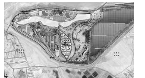
영산강변 저류지테마공원 조성 조감도

나주시가 문체부 주관 2018년 신규문화관광개발공모에서 8건이 선정돼 관광 인프라 구축에 탄력을 받게됐다. 나주시는 지난해 10월 문화체육관광부가 주관하는 '2018년 신규문화관광개발 공모사업'에서 '영산강변저류지 테마공원 조성사업' 등 8건이 선정돼 총 사업비 200억원(국비 128억원)을 확보했다고 25일 밝혔다. 세부 사업으로는 ▲영산강변 저류지 테마공원 조성사업 ▲경원동 인공폭포공원 조성사업 ▲빛가람 호수공원 관광자원화사업 ▲어린이놀이기원 조성사업 ▲남평 월련대산 인공폭포 조성사업 ▲나주의 꿈 전망탑 건립사업 ▲관광안내관 정비사업 ▲원옥제수변공원사업 등 총 8건이다. 시는 올해 기본 및 실시설계를 시작으로 오는 2021년 까지 사업을 완료할 계획이다. 또 시는 총 사업비 780억원 규모의 신규 관광 자원화사업 14건을 추가 발굴해 2019년도 국비예산을 신청한 상태다. /나주=김민수기자 kms@