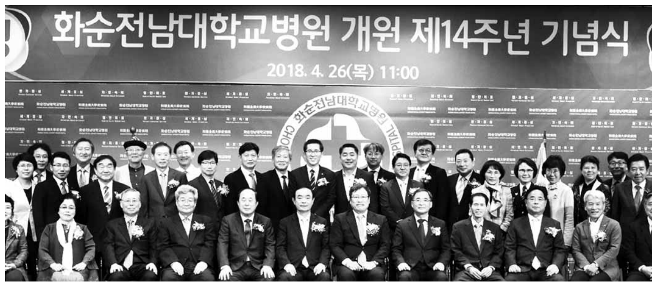
화순전남대학교병원 임직원들은 최근 개원 14주년을 맞아 기념식을 갖고 '제2의 도약'과 새로운 혁신을 다짐했다.

한편 화순전남대병원은 개원 14주년을 맞아 6월말까지 병원 안팎과 광주·전남 곳곳에서 다채로운 프로그램을 진행