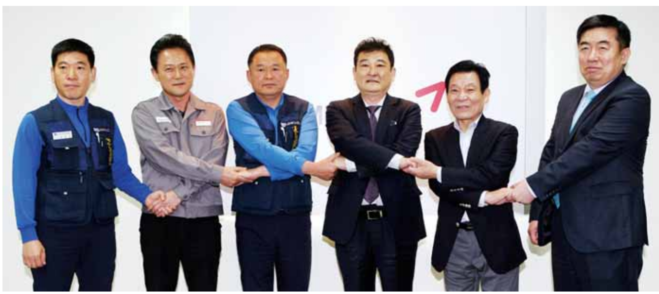
금호타이어 노사와 차이용선<왼쪽 네번째> 더블스타 회장, 윤장현<왼쪽 다섯번째> 광주시장 등이 지난 28일 4차 회담을 끝내고 손을 맞잡고 있다. <금호타이어 제공>