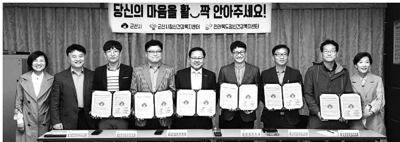
지난 30일 군산시 보건소는 군산의료원 등 5개 정신의료기관과 협약을 맺고 실제로 인한 상실감과 불안감에 싸여 있는 노동자와 가족을 위한 체계적 지원에 나서기로 했다.

정신건강 관련 확인을 위한 진단검사비용은 개인당 1회 최대 30만원이고 정신의료기관 입원 및 외래 치료 진료(상담)비용