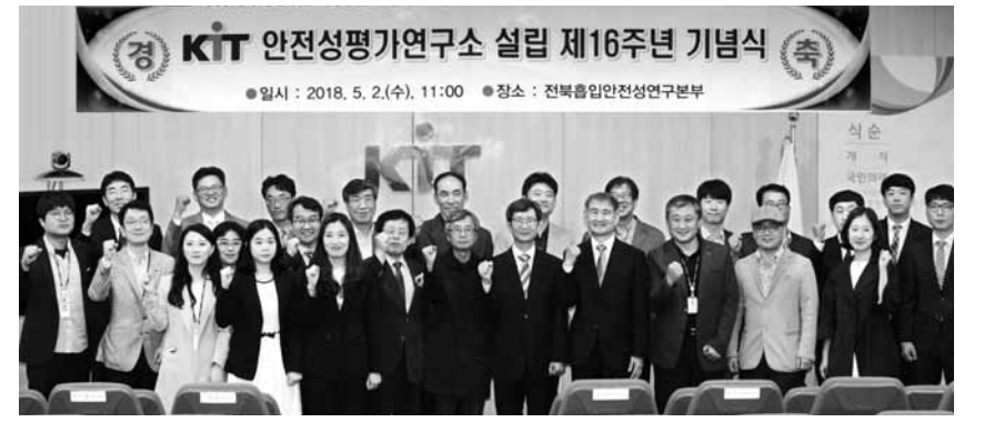
안전성평가연구소 설립 16주년 기념식