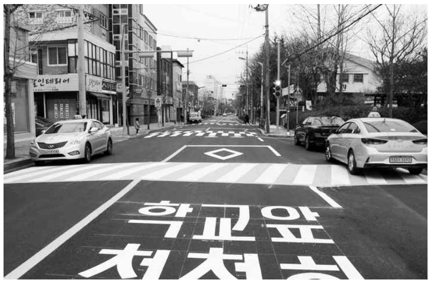
광주시가 시범적으로 북구 효동초교에 설치한 교원식 횡단보도.

3일 광주시는 "서구 풍암초교, 북구 효동초교 등 2개교 어린이보호구역에 시범적으로 실시해 학교 관계자, 학부모, 녹색어머니회 등으로부터 큰 호응을 얻었다"면서 "어린이보호구역 표준모델 확대 시행을 요구하는 민원도 많아 이번에 6개 초교에 추가로 확대·설치하기로 했다"고 밝혔다.