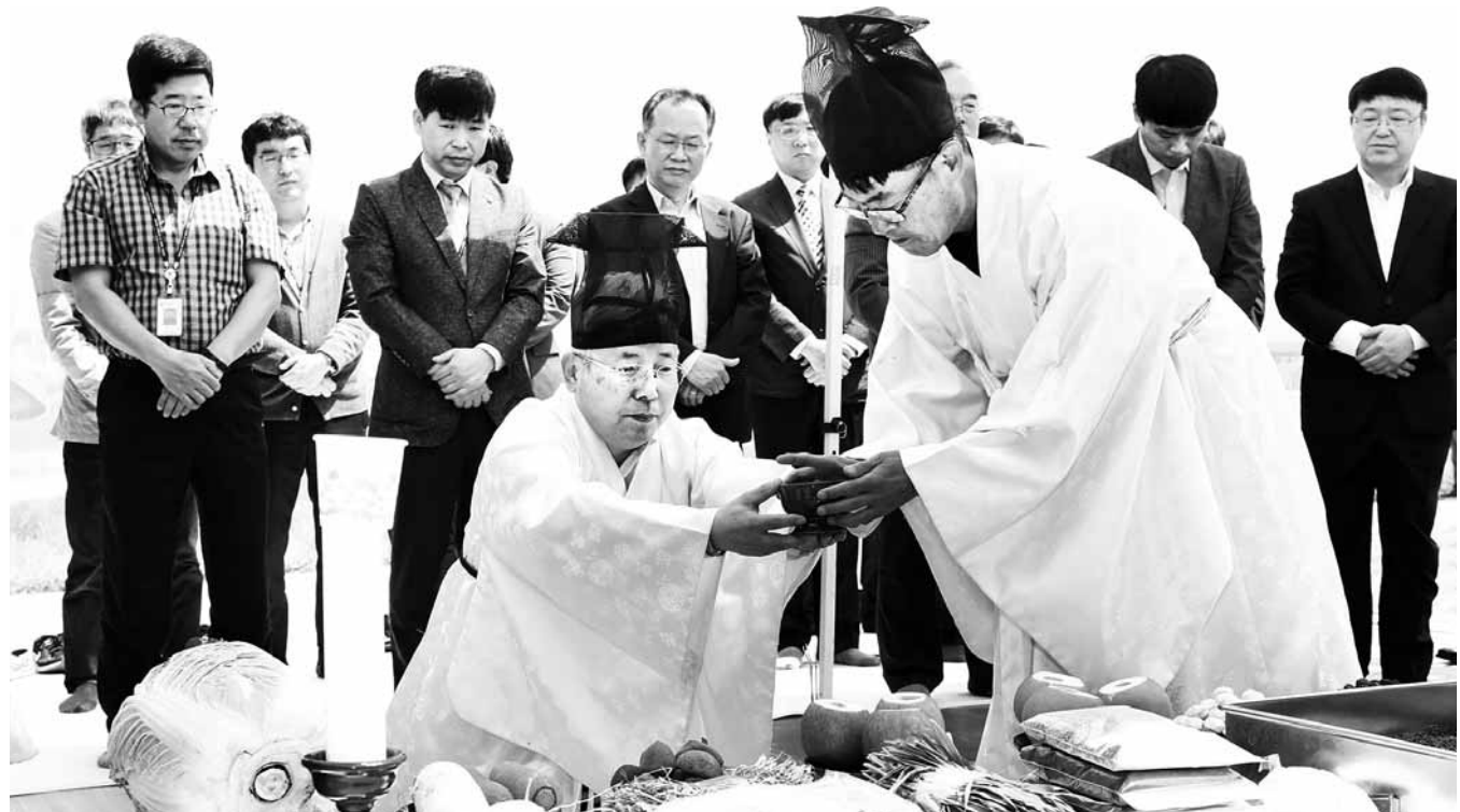
"가족 영혼 편히 잠들길" 농촌진흥청 국립축산과학원은 10일 전주 전북혁신도시 본원 내 축촌비 앞에서 축산시험 연구 과정 중 희생된 가족의 넋을 기리는 축촌제를 올렸다.