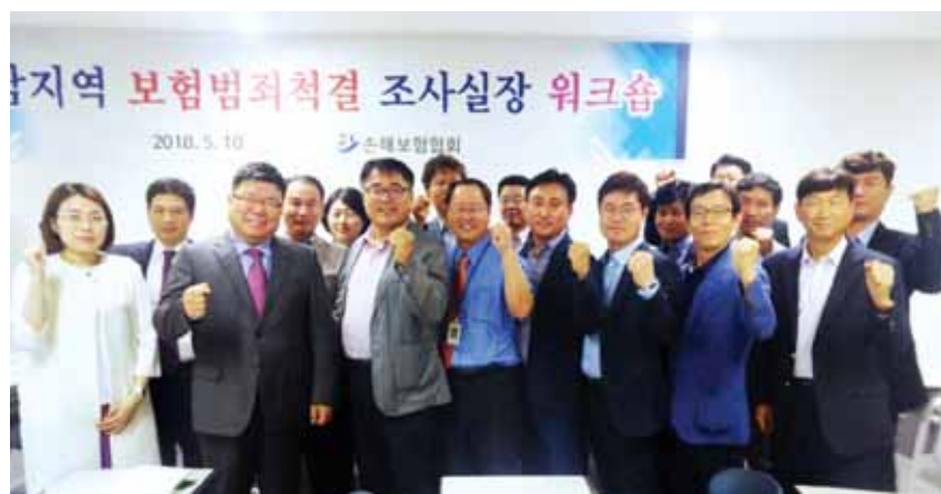
호남지역 보험범죄척결 조사실장 워크숍 2018. 5. 10 호남보험협회