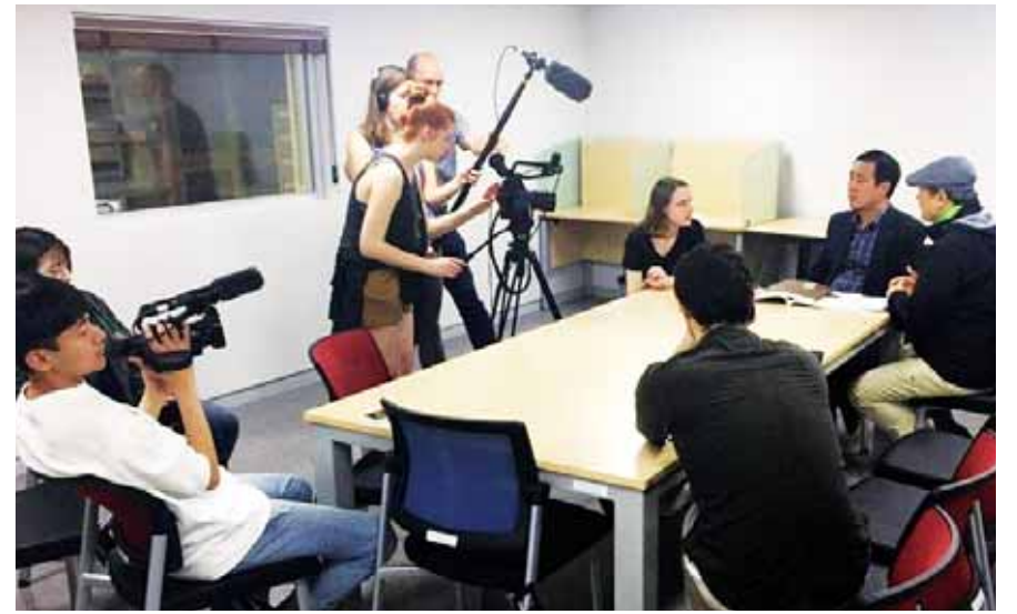
5·18다큐멘터리를 제작중인 프랑스 파리 에스트 대학 교수와 학생들이 지난 9일 5·18 기념재단을 찾아 인터뷰를 하고 있다.

는 “프랑스에서 배우지 못한 5·18에 대해 알게 된 것을 계기로 한국 현대사에 더 많은 관심을 갖게됐다”고 말했다. 한편 이들의 책임교수인 티에리 불리씨