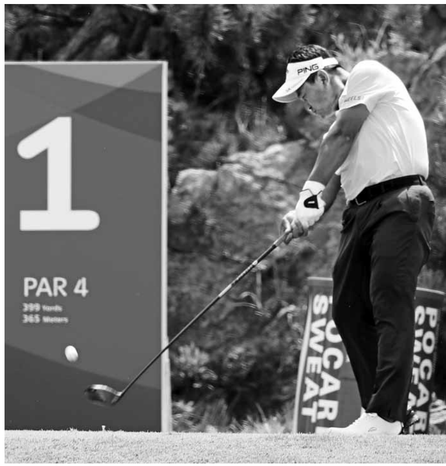
SK텔레콤오픈 골프대회 재능나눔 행복 라운드에서 티샷을 하고 있는 최경주.

까지 18홀을 다 돌 수 없는 시간대, 즉 트와일라잇 티타임에는 주니어들에게 코스를 내준다. 우리나라 골프장도 주니어