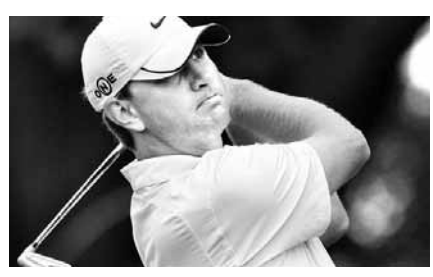
2009년 US오픈 우승자 루카스 글로버

미국 스포츠 전문 매체 ESPN은 16일 “지난주 미국 플로리다주 폰테 베드라 비치에서 열린 플레이어스 챔피언십 3라운드에서 글로버가 6오버파 78타를 치고 4라운드 진출에 실패한 뒤 부부싸움이 시작됐다”며 “12일 밤에 경찰에 체포된 크리스타는 다음 날 아침 보석금 2500 달러(약