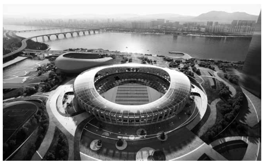
잠실종합운동장 주경기장 리모델링 조감도.

시 관계자는 “내년 상설 개관에 앞서 평창올림픽을 성공 개최한 지 100일이 지난 것을 기념하고 피서철 관광객들에게 올림픽 개최 도시의 모습을 간접 체험할 수 있도록 하고자 임시 개관하게 됐다”면서 “임시 개관 중 드러나는 문제점을 분석해 상설 개관 때 반영하겠다”고 설명했다. /연합뉴스