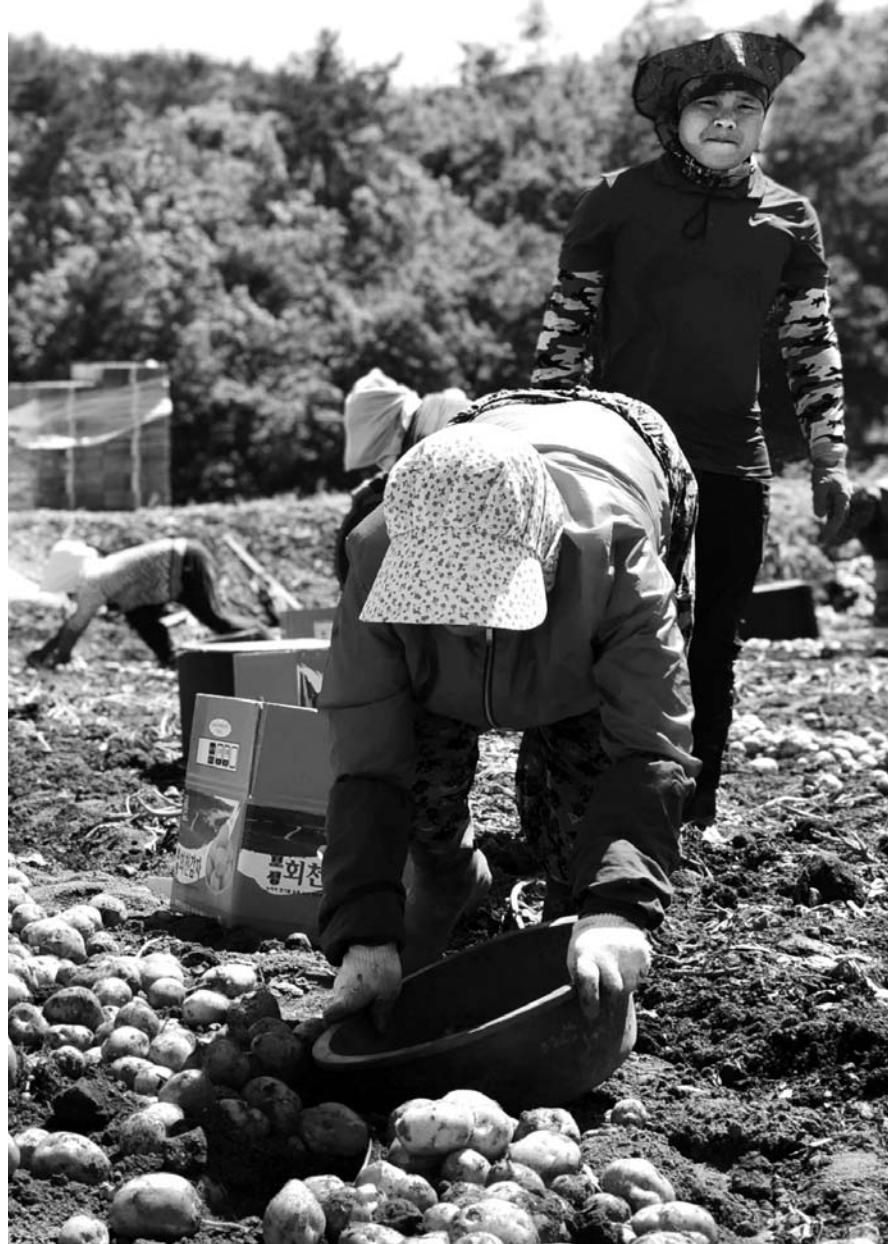
보성 햇감자 수확 한창 보성군 화천면과 득량면 등북에서 지역경제 효자작목인 햇감자 수확이 한창이다. 득량만 청정지역에서 재배되는 보성감자는 보성군 대표 농특산물로 토질이 우수한 황토 토양에서 자라 품질이 우수하며 일조량이 풍부한 득량만 해양성 기후의 영향으로 맛과 영양이 최고다.