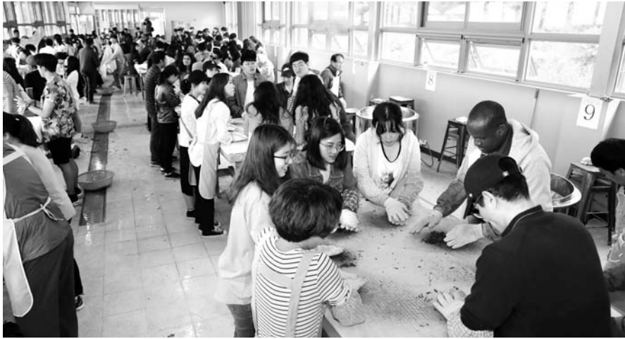
보성 다향대축제 '차와 차음식 만들기 체험관광'에 참가한 관광객들이 차를 뒤는 작업을 하고 있다.

35만명 다녀간 다향대축제 이후 전국서 프로그램 참가 문의 쇄도 10월까지 운영...다례교육도