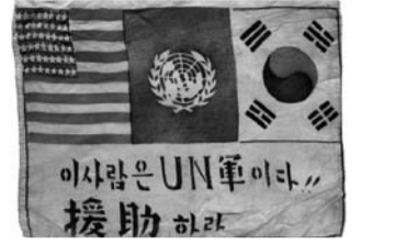
한국전쟁 당시 참전 미군이 사용한 태극기(사진 위)와 비행기 조종사 생활요청 표식인 블러드 칫.