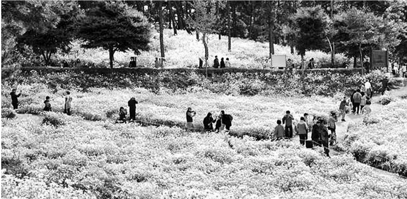
정읍시 산내면 매죽리 일대에 가을 야생화인 구절초를 심어 만든 구절초테마공원이 사계정원으로 변신한다. 매년 가을 열리는 구절초 축제 모습

구절초 테마공원 일대 2021년까지 60억 들여 사계정원으로 재구성 350m 짙라인도 설치