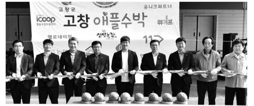
지난 8일 고창군이 '애플수박' 출하식을 열고 본격 유통에 착수했다.