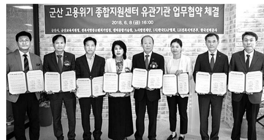
지난 8일 군산 고용위기지원센터가 지역 교육청과 중기청 등 유관기관과 업무협약을 맺고 본격 운영에 들어갔다.

3개월 이상의 교육과정으로 건설, 중장비, 전기 등 자격증 과정과 워크넷 및