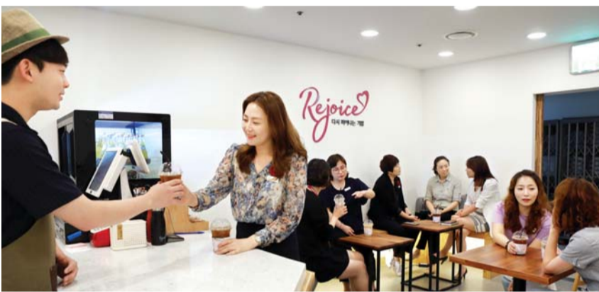
롯데백화점 광주점은 9일 백화점 7층에 카페형 심리상담소인 '리조이스 카페'를 열었다. 이 카페는 직원들이 커피를 마시며 편하게 심리상담을 받을 수 있는 형태로, 여성 임직원과 협력사 여직원의 우울증을 예방하기 위한 공간이다.