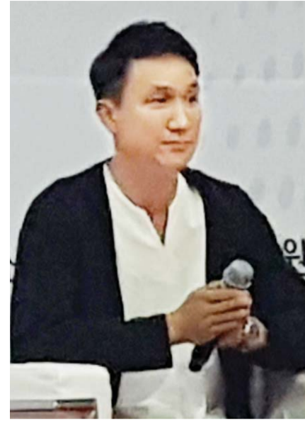
다"고 그간의 어려움을 털어냈다. 해남평화농수산물의 절임배추는 생산부터 가공과 유통까지 책임지는 게 특징이다. 배추의 기본에 충실하지는 생각이 신

자는 소박한 생각에서 시작했는데 시작을 하고 나니 돈이 보이더라"고 말했다. 그는 도시에서의 화려한 엔터테인먼트 사업을 뒤로 하고 호주로 건너가 농업을 공부했다. 귀국 후 해남에 자리를 잡고 절임배추를 새로운 사업아이템으로 선택했다. 지역 연고도 지인도 없는 해남에서 절임배추로 성공하기는 쉬운 일은 아니었다. 그는 "처음엔 몸으로 때워 배우자는 마음에서 외국인 노동자와 함께 배추밭·마을 밭에 가서 일하고, 전복 따는 배도 타 봤