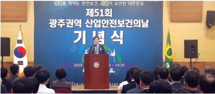
안전보건공단 광주지역본부(본부장 박남규)는 9일 광주시 서구 김대중컨벤션센터에서 광주지방고용노동청장, 광주경영자총협회 회장, 한국노총 광주본부장, 광주안실련 대표 등 250여명이 참석한 가운데 제51회 광주권역 산업안전보건의 날 기념식을 개최했다.