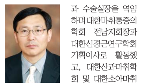
과 수술실장을 역임하며 대한마취통증의학회 전남지회장과 대한신경근연구학회 기획이사로 활동했고, 대한산과마취학회 및 대한소아마취학회에서 우수논문상을 수상하는 등 진료와 연구 분야에서 활발히 활동 중이다.