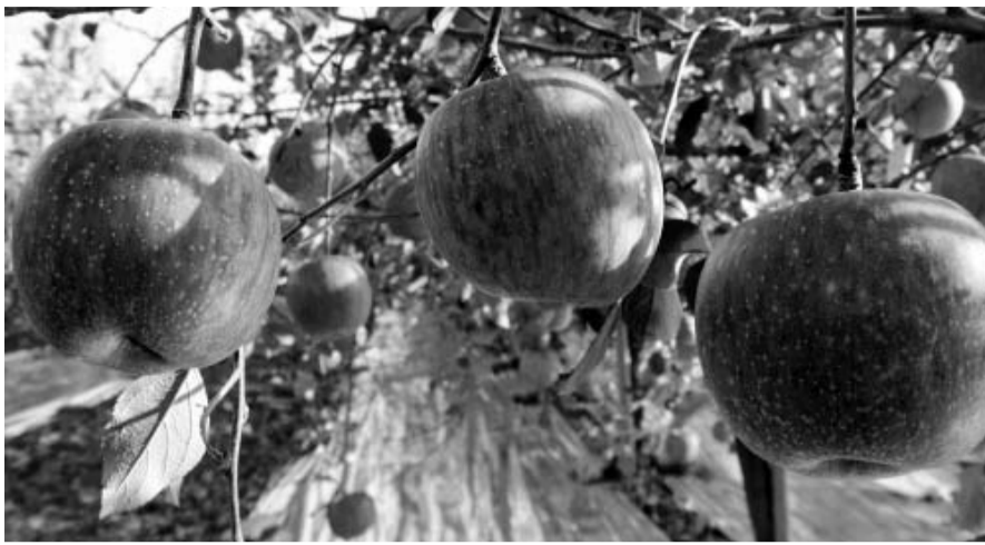
장성 백양사농협이 최근 농림축산식품부의 '2018 발작물공동경영체육성지원사업' 대상자로 선정됐다. 장성 사과.

발작물공동경영체지원사업 백양사농협 선정 2년간 생산능가 역량 강화 선별·저장 시설 등도 설치