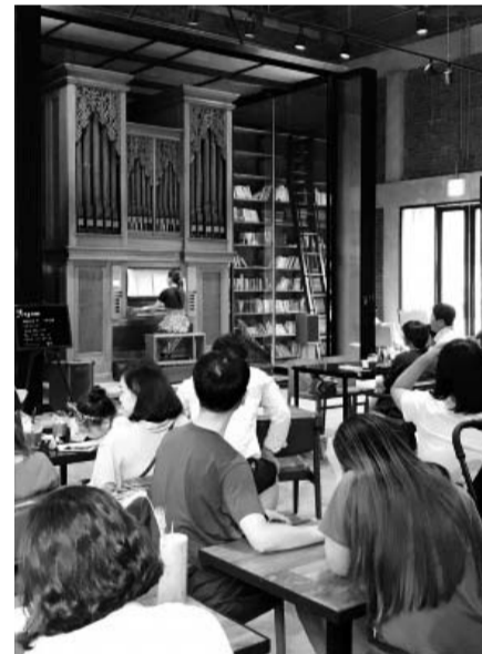
담빛예술창고를 찾은 관광객들이 국내 유일의 대나무파이프오르간 연주를 감상하고 있다.

간으로 탈바꿈한 '담빛예술창고'에는 문예카페와 작품전시관 등이 있다. 지역민과 방문객들의 쉼터 기능을 톡톡히 하며 2016년도에 16만여명, 지난해에는 18만여명이 이곳을 찾았다. 담양군문화재단 관계자는 "지난해 운영수익이 4억여원에 달한다"며 "운영수익은 수준 높은 문화예술사업을 통한 지역민, 방문객의 삶의 질 향상과 일자리창출 사업에 재투자하고 있다"고 말했다. 한편 담빛예술창고 전시관에서는 오는 9월 2일까지 '2018 국제 사진전-사진의 또 다른 관계성'전이 열린다. /담양=정재근 기자 jig@