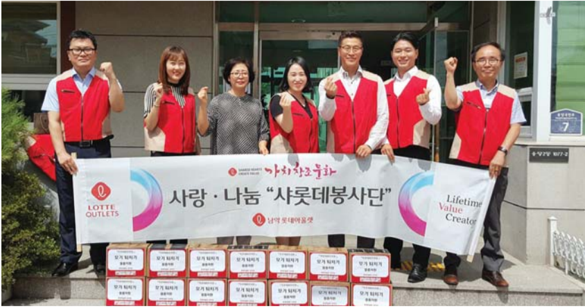
롯데아울렛 남악점 사롯데봉사단은 11일 모자가정 복지시설인 목포태모자원을 방문해 모기퇴치기 30여대 등 물품을 후원했다.