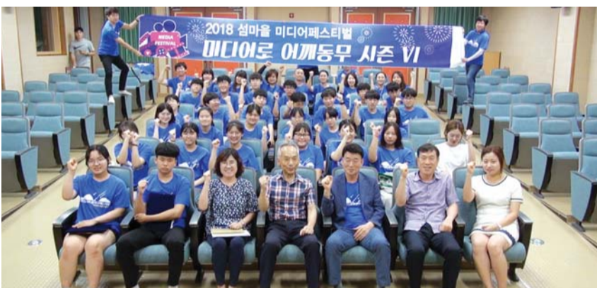
11일 신안 비금도 비금중학교에서 열린 '섬마을 미디어캠프'에 참여한 중학생들이 입소식을 치른 후 기념사진을 찍고 있다.