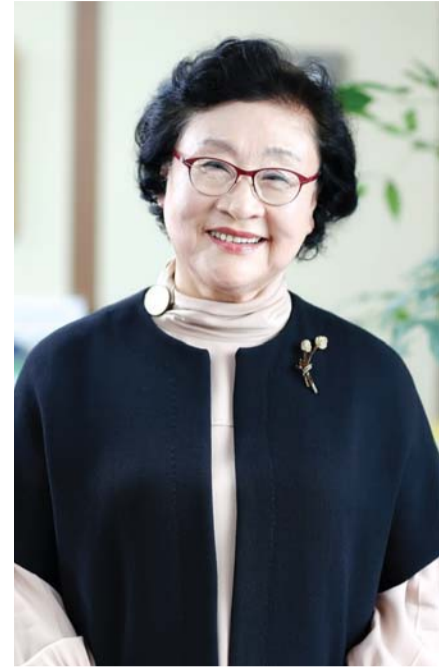
다양한 스킨십을 통해 학생들에게 ‘어머니 총장’으로 불렸다. 특히 김 총장은 교양 과목의 70%를 도덕성 인성 분야로 채웠을 뿐만 아니라 자

총장 취임 이후 8년 동안 학생들과 함께 하는 독서클럽, 학과별 신입생 특강, 학과 별 우수학생 취업 간담회를 진행하는 등