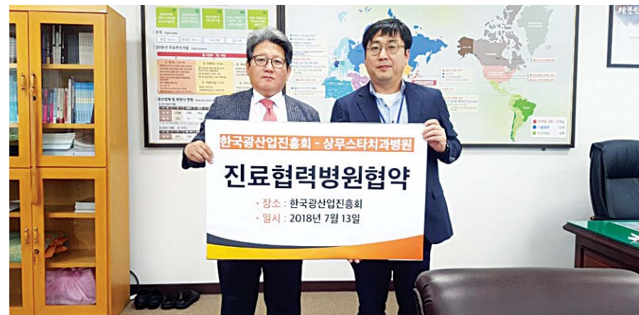
광주상무스타치과병원(대표원장 양승필·김운규)과 한국광산업진흥회(상근부회장 조웅진)는 최근 건강증진을 위한 진료협력 협약을 가졌다.