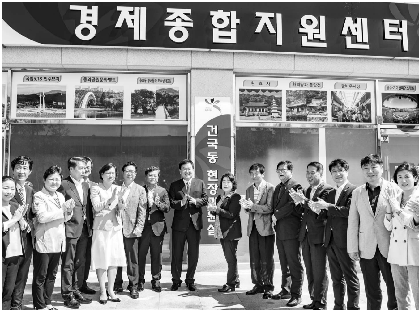
북구 경제종합지원센터 개소. 광주시 북구는 24일 신용동 문화신포 빌딩(첨단연신로 91번길 20-4)에서 지역경제 활성화와 민원편의를 제공하기 위해 경제 종합지원센터를 열었다.