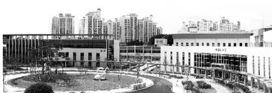
농업기술실용화재단은 내달 1일 익산 신청사로 이전을 마무리하고 제2의 도약을 준비한다. 재단 전경.