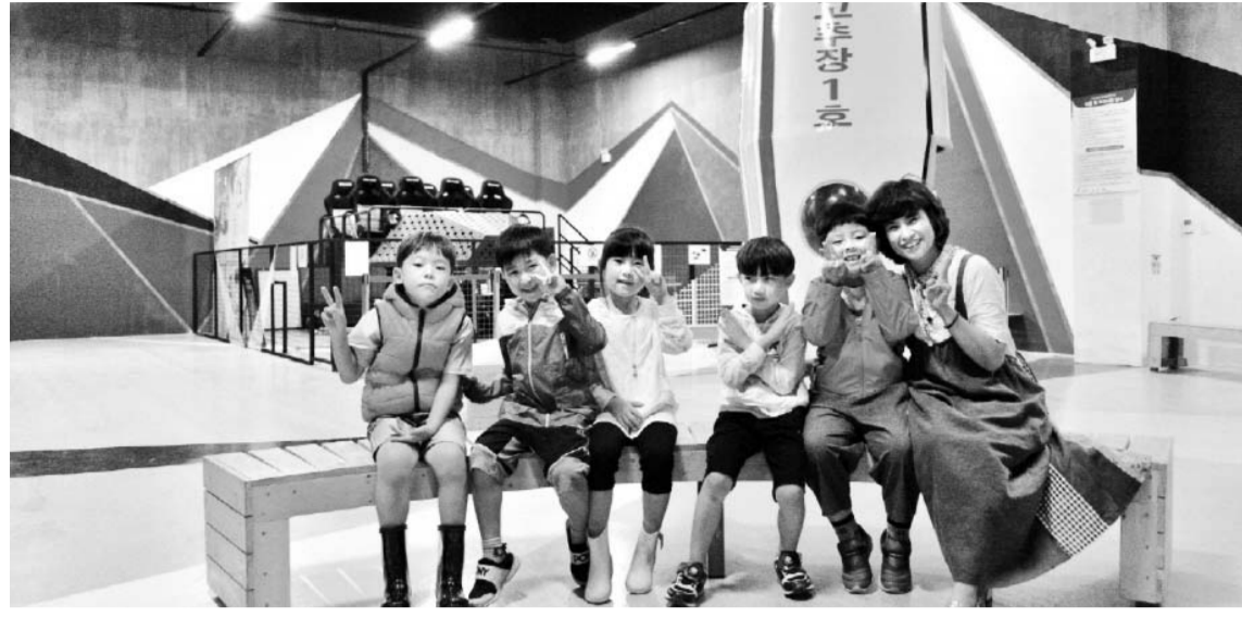
여름을 맞아 순창 발효소스토굴을 찾은 어린이들이 전시관을 둘러보고 귀여운 포즈로 사진을 찍고 있다.

순창 발효소스토굴 폭염에 인기 134m 길이 기온 15~18도 유지 10개 저장고·50개국 소스전시관 미디어 아트·VR 체험관 문 열여 올 관광객 2만명 돌파...25% ↑