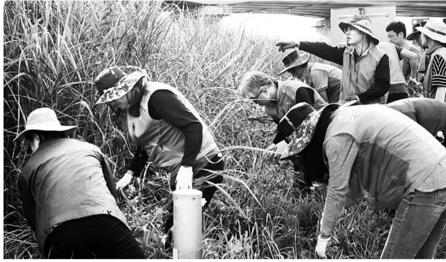
광주환경공단과 지역 환경단체 관계자들이 지난 30일 광주천 하류에 퍼지고 있는 가시박 등 외래식물을 제거하고 있다.