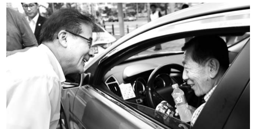
정중제 광주시 행정부시장은 폭염특보가 장기화되자 31일 오후 광산구 송정역 택시 승강장에서 대기하고 있는 택시기사들에게 시원한 얼음생수를 전달했다.