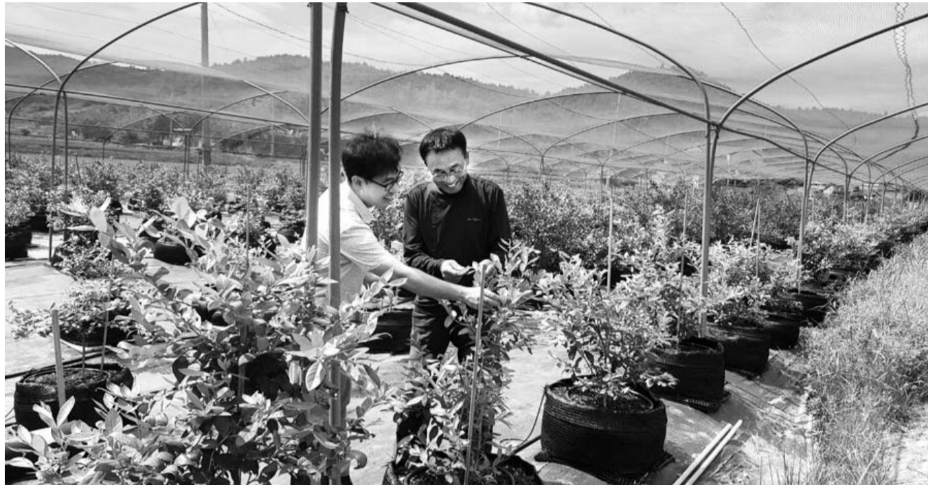
"폭염 속 농작물도 건강관리" 나주시 폭염피해 최소화 현장기술지원단이 다시면 블루베리 농장을 찾아 작목 상태를 확인하고 있다. 나주시는 배기술지원과장을 단장으로 작목별 현장기술지도 인력 18명을 편성해 폭염 피해가 우려되는 수도작(벼), 노지밭작물, 과수 재배단지를 중심으로 현장 지도 점검을 하고 있다.

나주시가 추석명절을 맞아 나주사랑상품권 '5% 할인' 행사를 실시한다. 나주시는 8일 추석을 앞두고 지역상권 활성화를 위해서 이달부터 다음달말까지 나주사랑상품권 행사를 실시한다고 밝혔다. 시는 지역상권 활성화를 도모하기 위해 해마다 설과 추석명절에 상품권 할인행사를 실시하고 있다. 상품권은 관내 농협, 광주은행, 신한 등 금융기관에서 현금 또는 직불카드로 구입할 수 있으며 가맹점으로 지정된 영산포 풍물시장, 목사고을 시장 등 전통재래시장을 비롯해 음식점, 의류 판매점, 커피전문점 등 1,491개소 점포에서 사용할 수 있다. /나주=손영철 기자 ycsn@