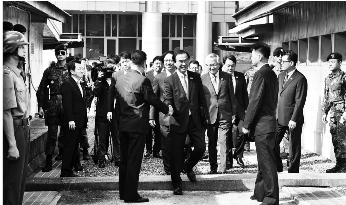
13일 판문점 북측 통일각에서 우리측 수석대표 조명균 통일부 장관 등이 남북고위급회담에 참석하기 위해 군사분계선을 넘고 있다.