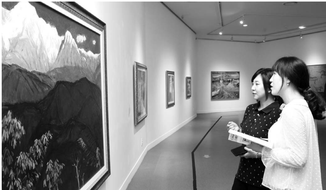
함평군은 9월 한달동안 함평군립미술관 제1전시실에서 '2017~2018 신소장품 전시회'를 개최한다. 지난해와 올해 수집한 80점 가운데 낙관배 화백과 이태길 화백 작품 등 20점을 전시할 예정이다. 30일 학예사들이 전시장을 미리 둘러보고 있다.