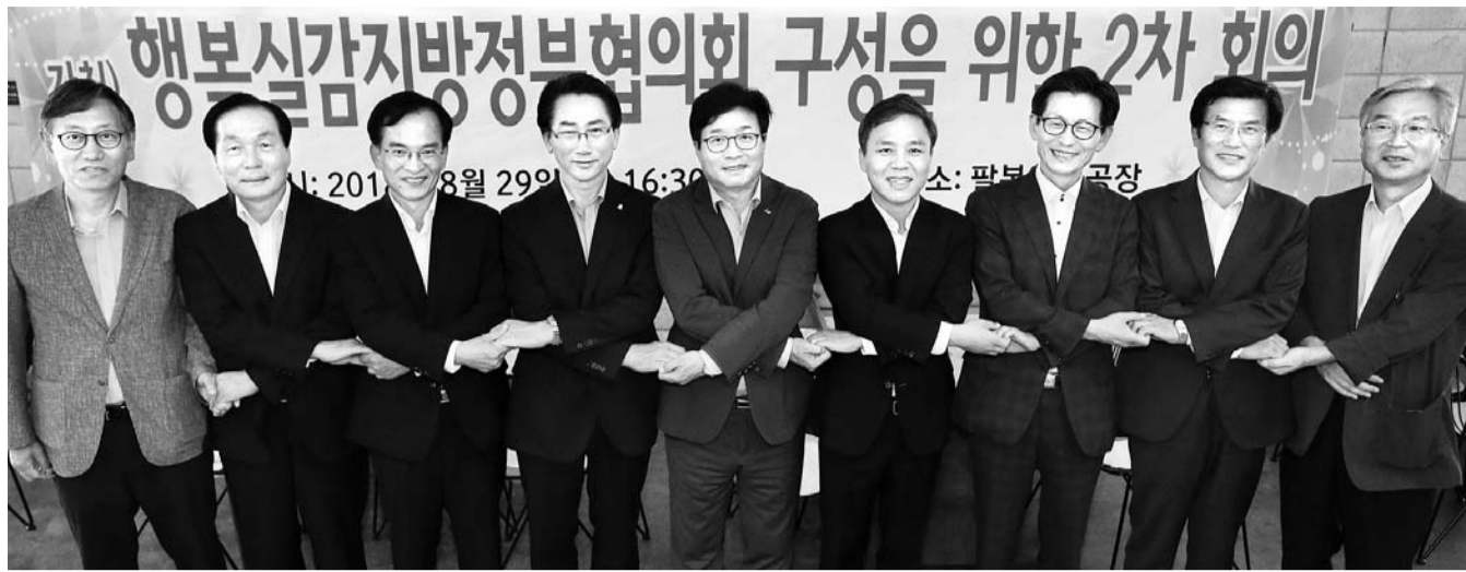
김승수 전주시장, 유기상 고창군수, 김삼호 광주 광산구청장 등 행복도시를 추구하는 전국 기초단체장들이 지난 29일 전주시 팔복예술공장에서 '행복실감 지방정부협의회(가칭)' 구성을 위한 2차 회의를 했다.

광주 광산구·전주시·고창군 등 전주시 '행복실감 협의회' 점검 분기별 행복정책포럼 개최 등 행복 관련 주요 사업계획 논의