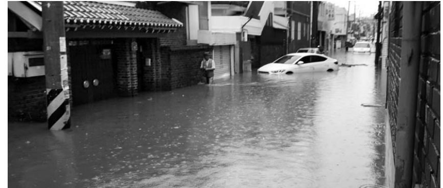
시간당 최고 61mm 비가 쏟아진 지난달 31일 광주시 남구 주월동 일대 주택, 차량 등이 물에 잠긴 모습.

했다. 또한, 현지 유통업체와 바이어들이 전시된 전남 제품에 큰 관심을 보여 앞으로 지속적인 수출 교류와 성과로 이어질 전망이다. /최원일 기자 cki@