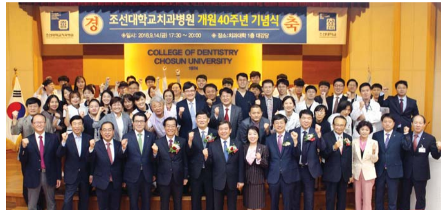
조선대학교병원(병원장 김수관)이 최근 치과대학 1층 대강당에서 개원 40주년 기념식을 가졌다.