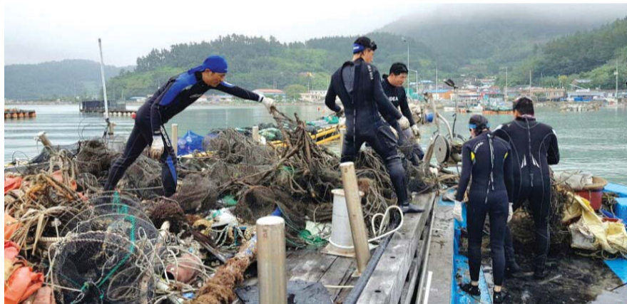
대한안전연합은 지난 15일 장흥군 회진면 일대 해상에서 폐어망과 수조 쓰레기 제거 등 해양수상정화활동을 펼쳤다.