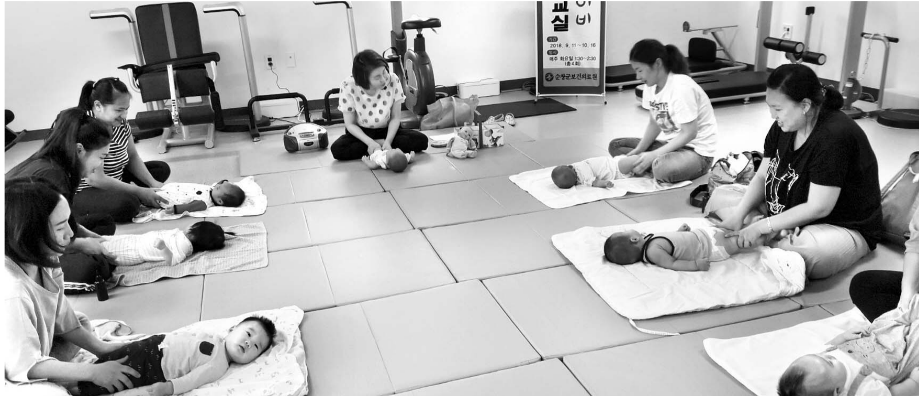
사랑의 베이비마사지 교실

영광군 관계자는 "그동안 굴비를 가게 앞이나 도로에 내놓고 건조해 비위생적이라는 지적이 많았다"며 "부지, 예산 확보 등 문제로 건립이 미뤄졌지만 내년에는 공사에 들어갈 수 있을 것으로 예상된다"고 말했다. /영광=이준용 기자 jylee@