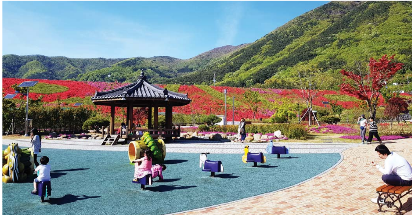
화순 동구리호수공원 일대는 잘 정비된 숲과 수려한 경관이 어우러져 휴양지로 손색이 없다.