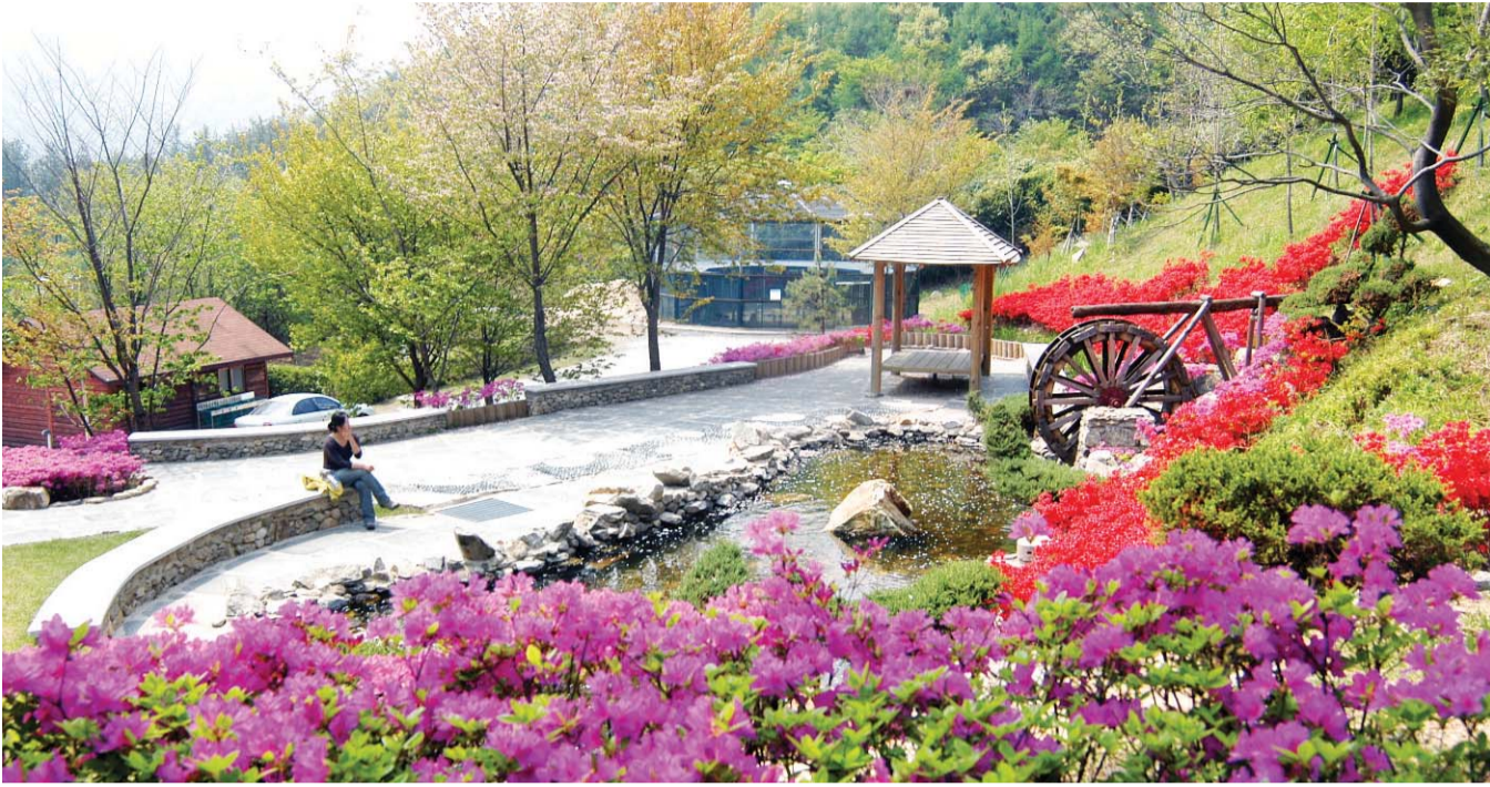
16동의 휴양공간을 운영하고 있는 백아산 자연휴양림은 전국의 힐링 관광객에게 인기를 끌고 있다.