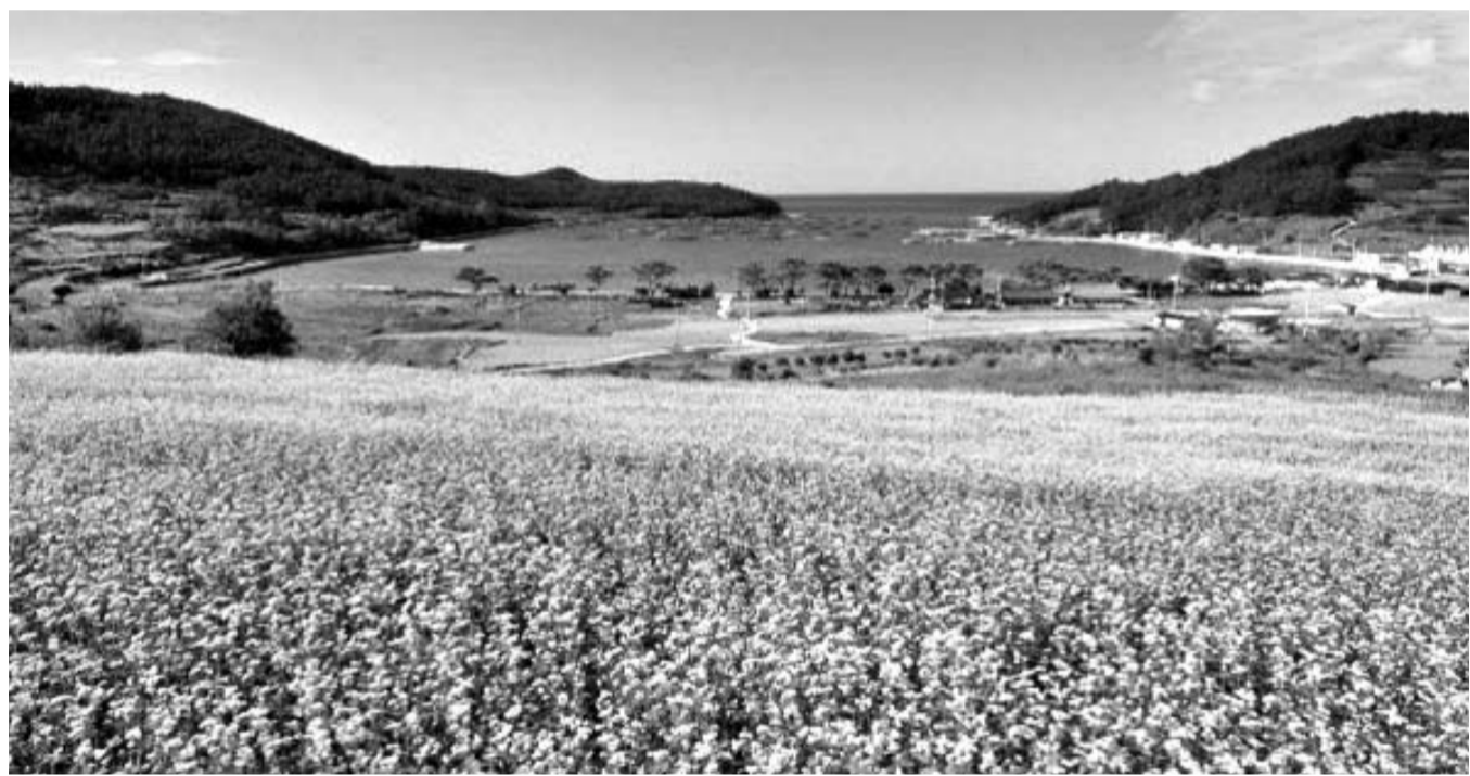
청산도 메밀꽃 '힐픽' 가을여행 '만끽' 완도군 청산도에 소금을 뿌려 놓은 듯 하얀 메밀꽃이 활짝 피어 장관을 이루고 있다. 오는 19일부터 21일까지 이곳에서 '2018 청정완도 가을빛 여행'이 열린다.