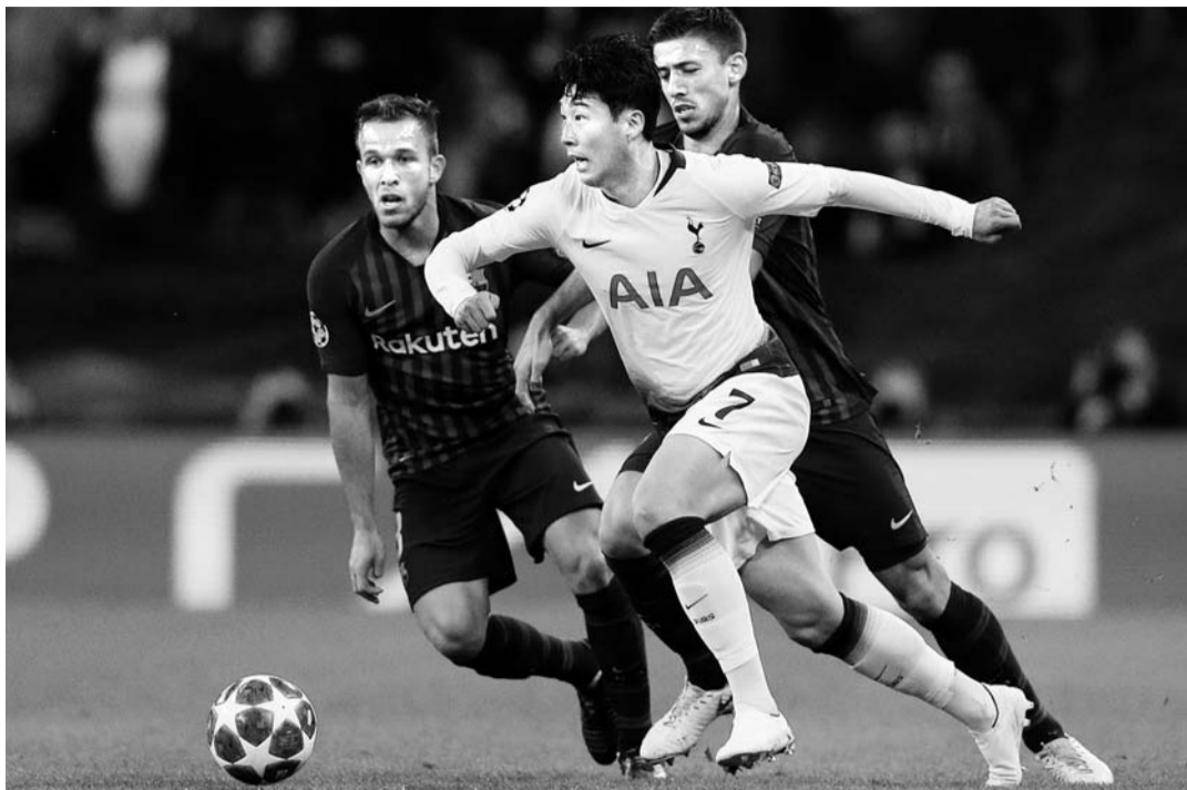
토트넘(잉글랜드)의 손흥민이 3일(현지시간) 영국 런던 웨블리 스타디움에서 열린, 바르셀로나(스페인)와 2018-2019 유럽축구연맹(UEFA) 챔피언스리그 조별리그 B조 2차전에서 상대 선수들을 제치며 공을 몰고 있다.

수아레스가 왼쪽 측면으로 쇄도하던 쿠티뉴에게 이어졌다. 쿠티뉴가 후방으로 다시 내준 볼을 이반 라키티치가 달려들면서 오른쪽 슈팅으로 토트넘의 골대를 흔들었다.