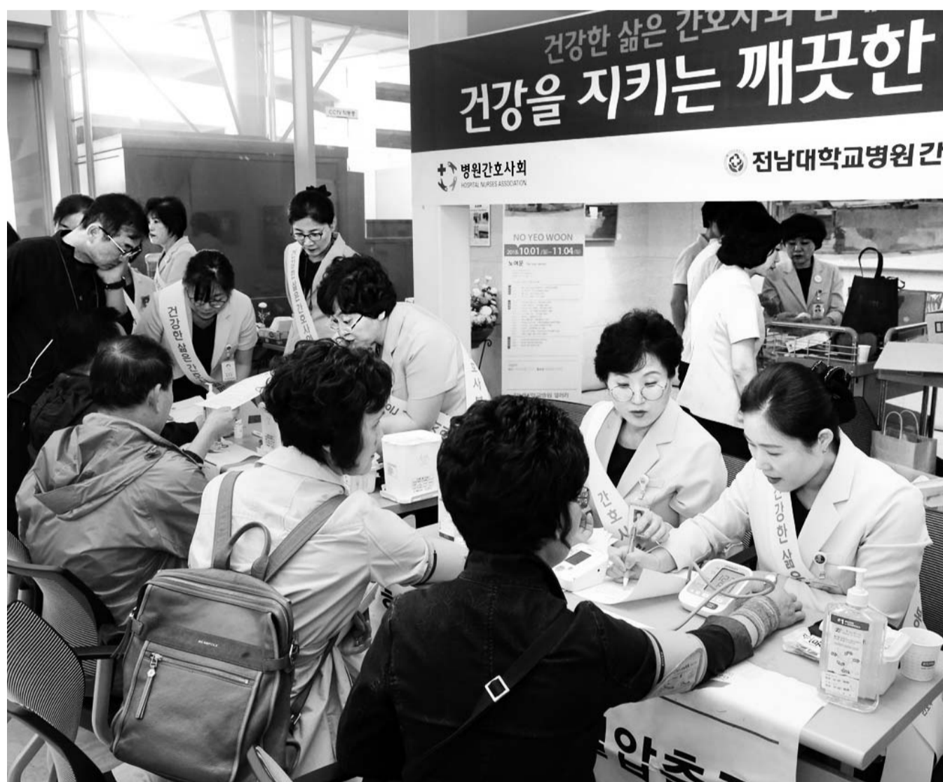
"혈압 체크해 봅시다" 천사데이를 주관한 전남대병원 간호부가 혈압측정과 혈당검사 등 건강체크 봉사활동을 하고 있다.