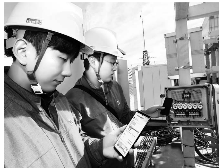
KT는 올해 범정부 차원 '기가코리아 사업'의 재난안전, 자율주행, 스마트시티 분야에 참여해 기술개발을 진행한다. KT 직원이 건물에 설치된 '사물인터넷 센서 박스'를 활용해 건물의 기울어짐, 변형 및 균열 등의 데이터를 측정하는 모습.

KT는 재난 상황 별 맞춤형 대응 정보 제공 기능 개발도 책임진다. 이 시스템을 활용하면 사고 혹은 재난 발생지역 인근의 CCTV와 화재 감지 센서들이 5G 네트워크로 현장 상황을 상황실과 주변의 사람들에게 생생하게 전달해 피해 확산