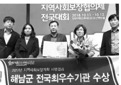
지역사회 복지 활성화를 위한 땅끝해남 희망더하기 사업을 민관 협력으로 운영하고 있다고 군은 설명했다. /해남=박희석 기자 dia@

해남군지역사회 맞춤형 복지서비스가 전국 최우수 평가를 받았다. 16일 해남군에 따르면 최근 창원컨벤션센터에서 열린 '제13회 지역사회보장협의체 전국대회'에서 최우수기관상(사진)을 받고 포상금 3000만원도 확보했다. 군은 일반복지 7개 분야 73개 사업과 중점추진핵심 29개 사업 등 총 102개 사업을 민·관 협력으로 추진 중이다. 농촌 특성에 맞는 맞춤형 복지서비스로 전남지역 최초 고용·복지플러시 센터를 운영해 맞춤형 고용·복지서비스를 제공한 점이 높은 평가를 받았다.