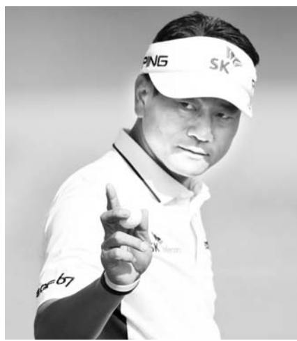
25일 경남 김해 정산CC에서 열린 '현대해상 최경주 인비테이셔널' 1라운드. 최경주가 4번홀 그린 홀아웃 후 갤러리에 인사하고 있다. /연합뉴스

"내일은 어떻게 해서든 언더파를 쳐야겠다"고 다짐한 최경주는 "연습을 해야겠다"며 연습장으로 발걸음을 옮겼다. /연합뉴스