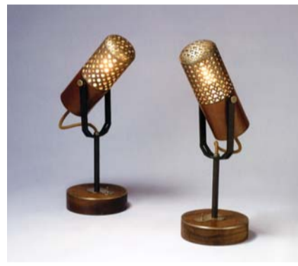
고은정 작 'Mic'

말이 천리 간다'를 비롯해 동화 '아기돼지삼형제'를 모티브로 한 브로치, 마이크를 형상화한 작은 조명등 등이 눈길을 끈다. 고은정·권태경·김가희·김지완·남은정·동건진·왕동양·김민정·김범창·김승환·김주미·안상근·윤세경·이효근·전세별씨 등이 참여했다.