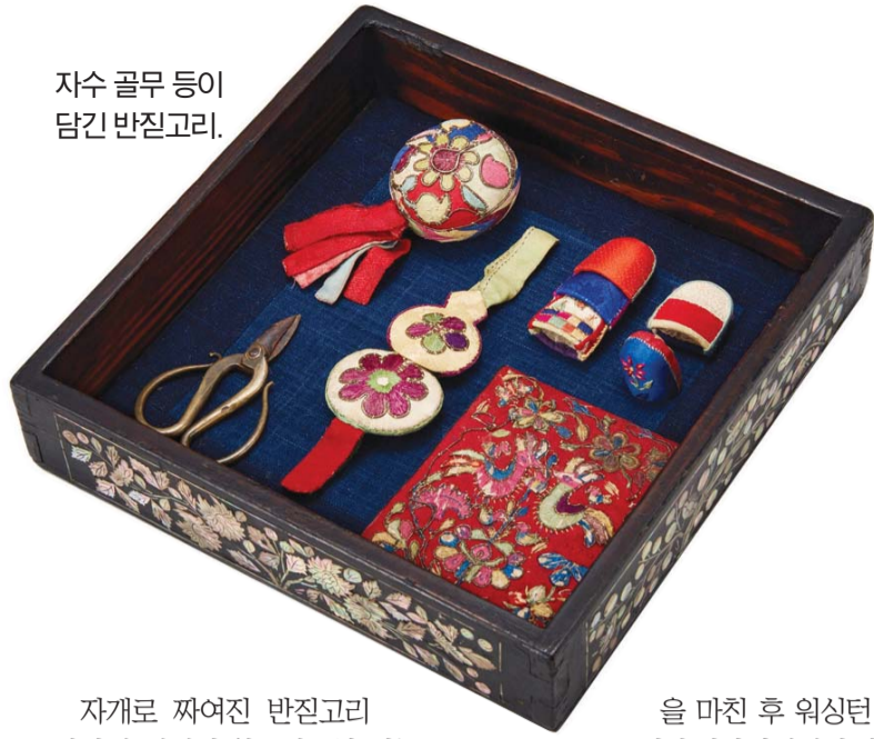
자수 골무 등이 담긴 반진고리.