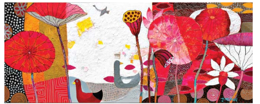
정미희 작 'lotus story'