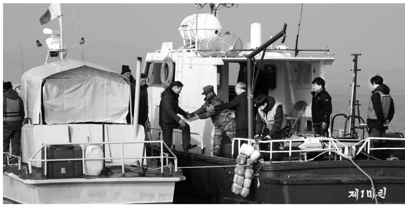
남북 공동한강하구수로 조사가 시작된 5일 강화 교동도 북단 한강하구에서 운양회 공동조사단장과 북측조사단이 만나고 있다.

채용 비리 신고는 국민신문고(www.epeople.go.kr), 권익위 홈페이지(www.acrc.go.kr) 등을 통해 할 수 있고, 정부대표 민원전화 국민콜(110)과 부패·공익 신고상담(1398)으로 전화하면 상담받을 수 있다.