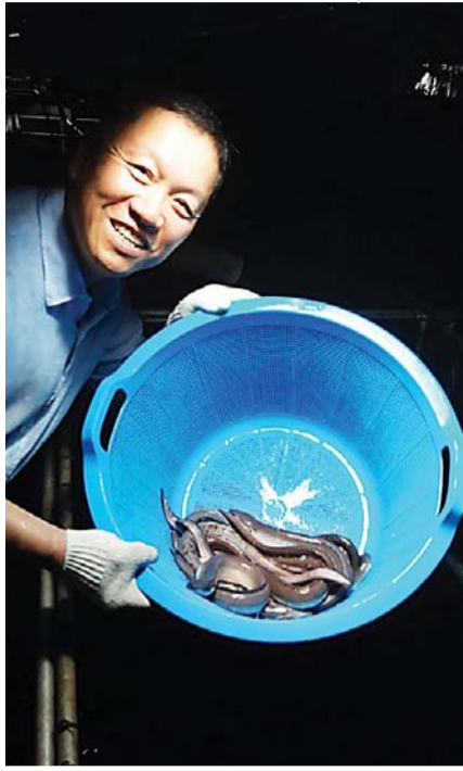
중장비 사용료 등에만 5000만 원이 십시간에 사라졌다. “양어장을 하려면 물이 좋아야 하고 그걸 확인하려면 장비로 관정을 뚫어야 합니다”

마음이에요” 그가 독하게 귀어를 결심한 때는 수중에 돈이 제법 모였던 지난 1995년. 30대 중반의 그는 생각과 달리 2년 가까이 돈만 날리고 허송세월을 했다. 양어장을 짓기 위해 남도 땅 곳곳을 둘러보며 물 좋은 터를 찾아 다녔지만 시간과 돈만 쏟아 붓고 제대로 된 터를 잡지 못한 것이다. 민물장어를 기르기 위해선 관정 한 곳당 하루에 200~300t의 지하수가 나와야 했지만 그가 손을 댄 영암군 신북면, 무안군 청계면, 강진군 병영면 땅은 관정을 팔 때마다 물의 양이 크게 못 미쳤다. 지하수 관정을 파기 위해 체결했던 부지 계약액 대금,