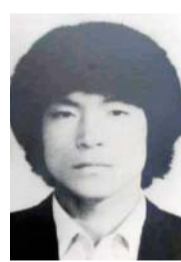
5·18민주묘지에 방문하면 묘소와 공적사항을 확인할 수 있다”고 말했다.